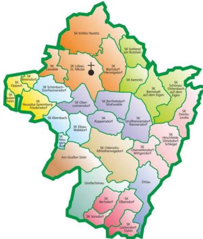
Kirchenbezirk Löbau-Zittau 2014