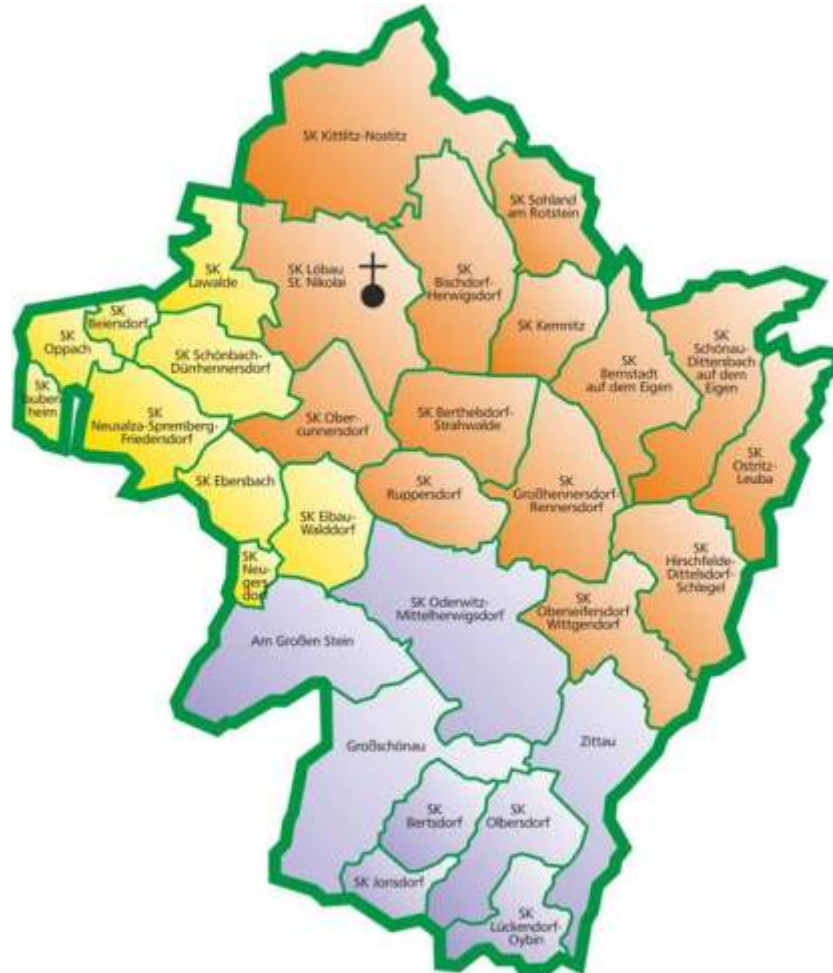
Kirchenbezirk Löbau-Zittau 2019